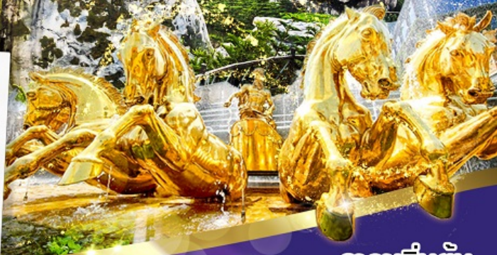
ราคาเริ่มต้น

บุฟเฟ่ต์นานาชาติ บนบ้าน่าฮิลล์ 2 มื้อ และ SEAFOOD 1 มื้อ