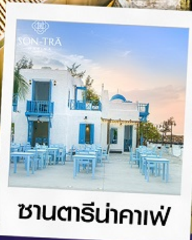
ซานตารีน่าคาเฟ่