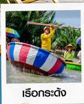
เรือกระดิง