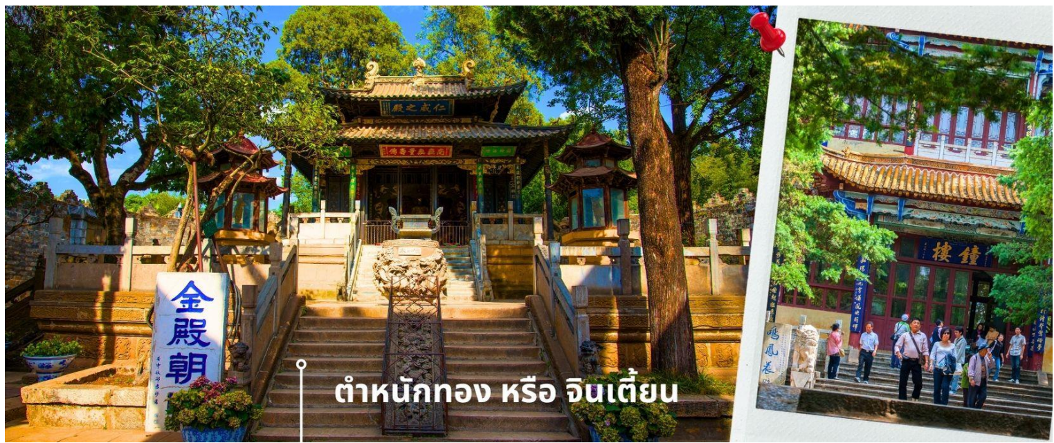
ต้าหนังกทง หรือ จินเตี้ยน

เที่ยง 📍 รับประทานอาหารกลางวันที่ภัตตาคาร (14) นำท่านเยี่ยมชม ต้าหนังกทง หรือ จินเตี้ยน (The Golden Temple Park | Jindian park) (ไม่รวมค่ารถแบตเตอรี่ 10 หยวน/ท่าน) โบราณสถานสำคัญของมณฑลยูนนาน ที่ได้รับการปกป้องดูแลโดยรัฐบาลจีน ตั้งอยู่บริเวณเชิงเขาหมิงเฟิง ล้อมรอบด้วยแนวกำแพงและหอคอยเหมือนเป็นป้อมปราการ ต้าหนังกทงถูกเรียกตามลักษณะอาคารที่มีสีทองอร่าม จากทองเหลืองในส่วนของผนังและหลังคา รวมกว่า 200 ตัน โดยถือเป็นสิ่งปลูกสร้างสัมฤทธิ์ที่ใหญ่ที่สุดของจีน ภายในมีรูปปั้นทองโดยมีเงินอยู่ (เสวียนอู่) เทพเจ้าลัทธิเต๋าเป็นองค์ประธาน