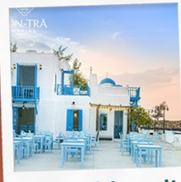
ซานตารีน้ำกาแฟ