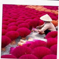
หมู่บ้านรุปรุ