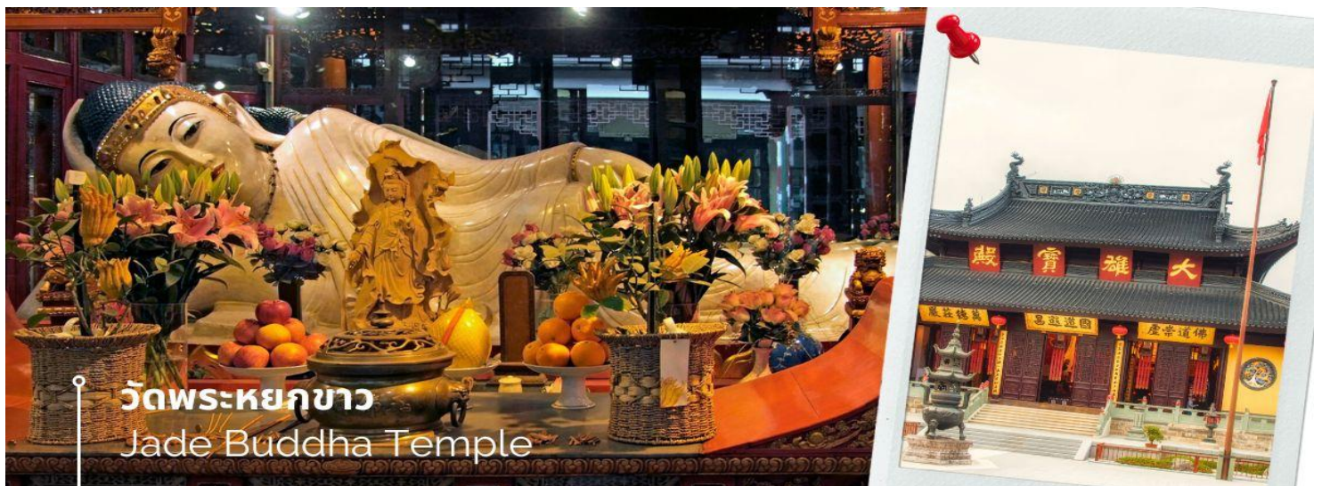
วัดพระหยกขาว Jade Buddha Temple

เช้า 📍 รับประทานอาหารเช้า ณ ห้องอาหารโรงแรม (12) นำท่านชม วัดพระหยกขาว เป็นวัดที่มีชื่อเสียงมากที่สุดในเมืองเชียงใหม่ ซึ่งเป็นที่รู้จักจากพระพุทธรูปสององค์ที่สร้างขึ้นจากหยกทั้งแท่ง องค์พระพุทธรูปปางนั่งมีความสูง 190 เซนติเมตร และ หุ้มด้วยเพชรพลอย หิน มโนรา และ