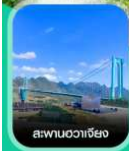
สะพานฮวาเจียง