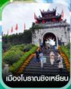
เมืองโบราณชิงเหยียน

คอนเฟิร์มออกเดินทาง ทุกพีเรียด 2 ท่านขึ้นไป