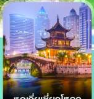
หอเจียเซียงโหลว