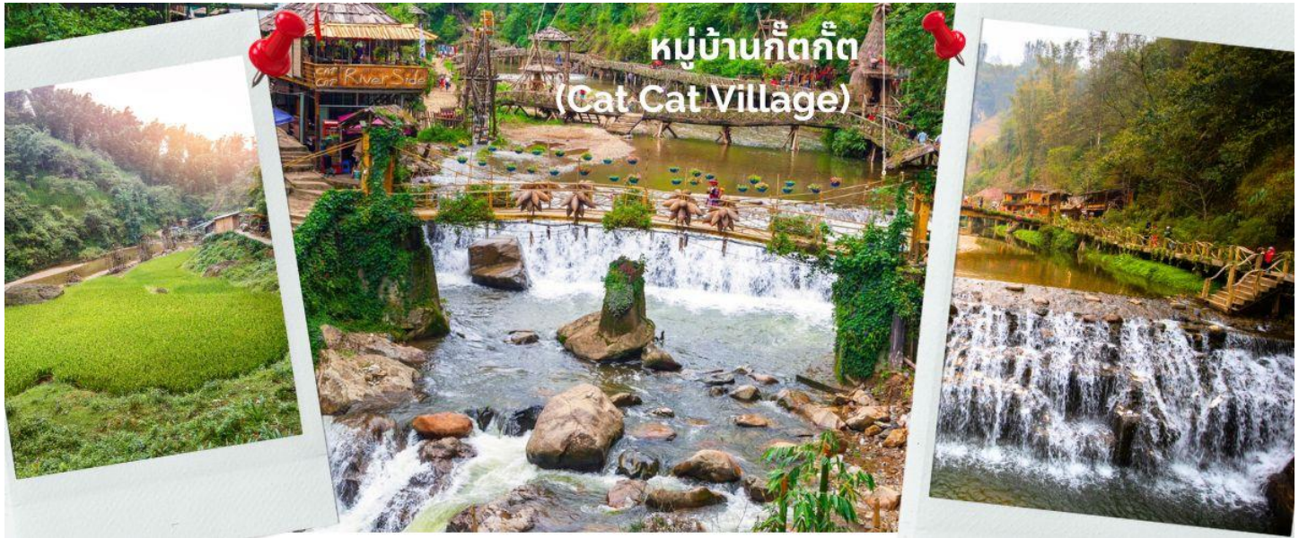
หมู่บ้านก๊ตก๊ต (Cat Cat Village)

ค่ำ รับประทานอาหารค่ำ ณ ภัตตาคาร เมนูพิเศษหม้อไฟปลาแซลมอน (7)