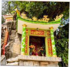
ศาลเจ้าตังซาว