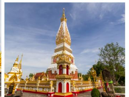
พระธาตุพนม