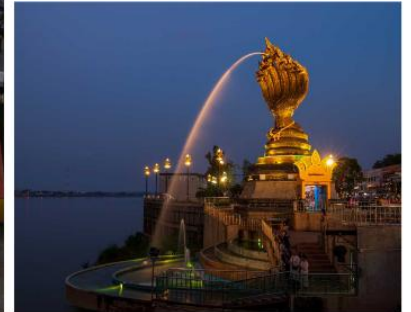
พญาศรีสัตตนาคราช