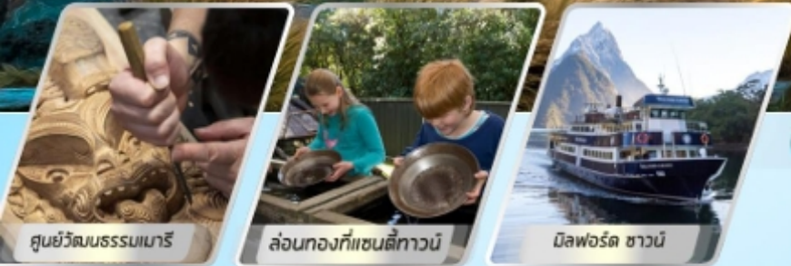
ศูนย์วัฒนธรรมเมารี