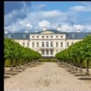
พระราชวังธุนดาลี