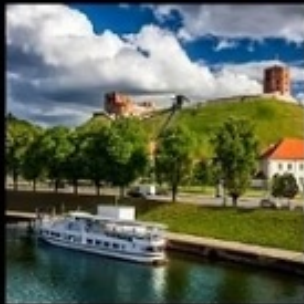
วิลนีอัส