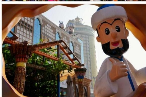
ตลาดนานาชาติซินเจียงแกรนด์บาร์ซาร์