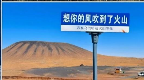
อุทยานภูเขาไฟอูลันฮาตา (Wulanhada Volcano Geopark)