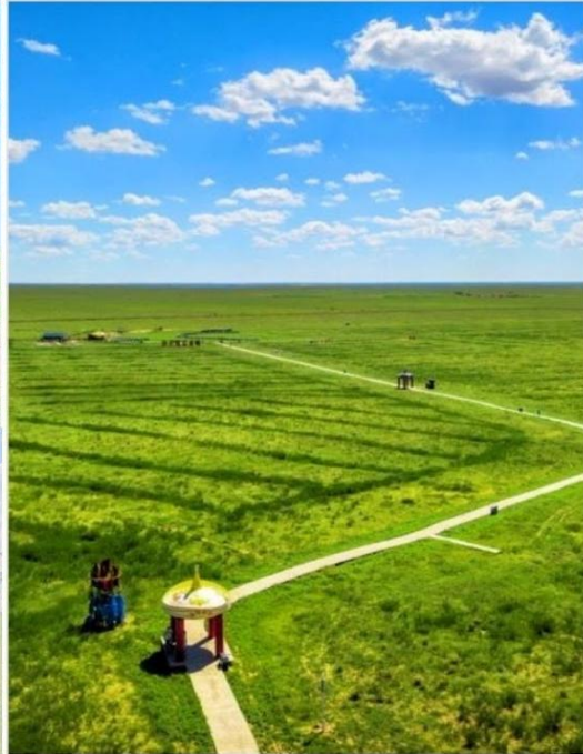
ทุ่งหญ้าออร์ดอส (Ordos Prairie)

บ่าย นำท่านชม ทุ่งหญ้าออร์ดอส (Ordos Prairie, 鄂尔多斯草原) เสน่ห์แห่งมองโกเลียในแหล่งธรรมชาติอันงดงาม ที่ซึ่งท้องฟ้ากว้างใหญ่ทอดยาวเหนือพรมแดนแห่งทุ่งหญ้าเขียวขจีตลอดสาย ผืนฟ้าใบธรรมชาติขนาดใหญ่ที่รอให้คุณมาสัมผัสความงดงามและเสน่ห์อันบริสุทธิ์ ทุ่งหญ้าออร์ดอส ไม่ได้เป็นเพียงแค่พื้นที่กว้างใหญ่ แต่ยังเป็นศูนย์รวมของวัฒนธรรมและประวัติศาสตร์อันยาวนานของชาวมองโกล ที่นี่คุณจะได้เห็น กระจอมเกอร์ (Ger หรือ Yurt) ตั้งเรียงรายอยู่บนเนินหญ้า ตัดกับท้องฟ้าสีคราม และฝูงสัตว์ที่เล็มหญ้าอย่างสงบ นี่คือภาพจำลองชีวิตที่ยังคงรักษาไว้ซึ่งความเรียบง่ายและเป็นอิสระ ทุ่งหญ้าออร์ดอสเป็นสวรรค์ของช่างภาพ ด้วยทิวทัศน์อันกว้างใหญ่ แสงยามเช้าและยามเย็นที่งดงาม และวิถีชีวิตที่น่าสนใจ