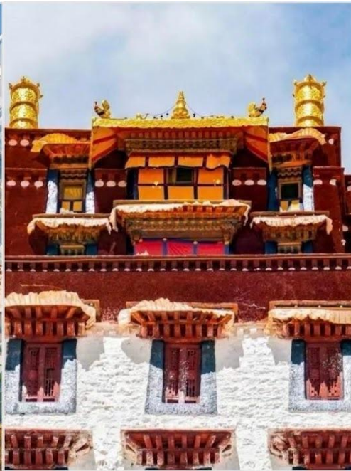
พระราชวังโปตาลา (Potala Palace)