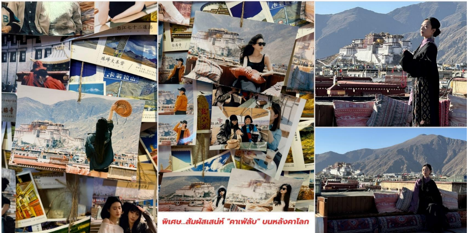
พิเศษ...สัมผัสเสน่ห์ "คาเฟ่ลับ" บนหลังคาโลก

พิเศษ...สัมผัสเสน่ห์ "คาเฟ่ลับ" บนหลังคาโลก ประสบการณ์การท่องเที่ยวที่ผสมผสานความสงบ จิตวิญญาณ และความงามระดับโลกเข้าด้วยกัน ไม่มีที่ไหนจะสะกดสายตาได้เท่ากับการได้นั่งจิบเครื่องดื่มอุ่นๆ พร้อมวิว "พระราชวังโปตาลา" (Potala Palace) บน "คาเฟ่ลับบนดาดฟ้า" รวมค่าเช่าหรือกาแฟท่านละ 1 แก้ว จากนั้นให้ท่านได้อิสระเดินชมวิถีศรัทธาหรือเลือกซื้อของฝากที่ ถนนบาร์คอร์ด นอกจากนี้จะเป็นเส้นทางแสวงบุญแล้ว บาร์คอร์ดยังเป็นตลาดโบราณที่มีชีวิตชีวาและเป็นแหล่งช้อปปิ้งของที่ระลึกที่สำคัญที่สุดของทิเบต