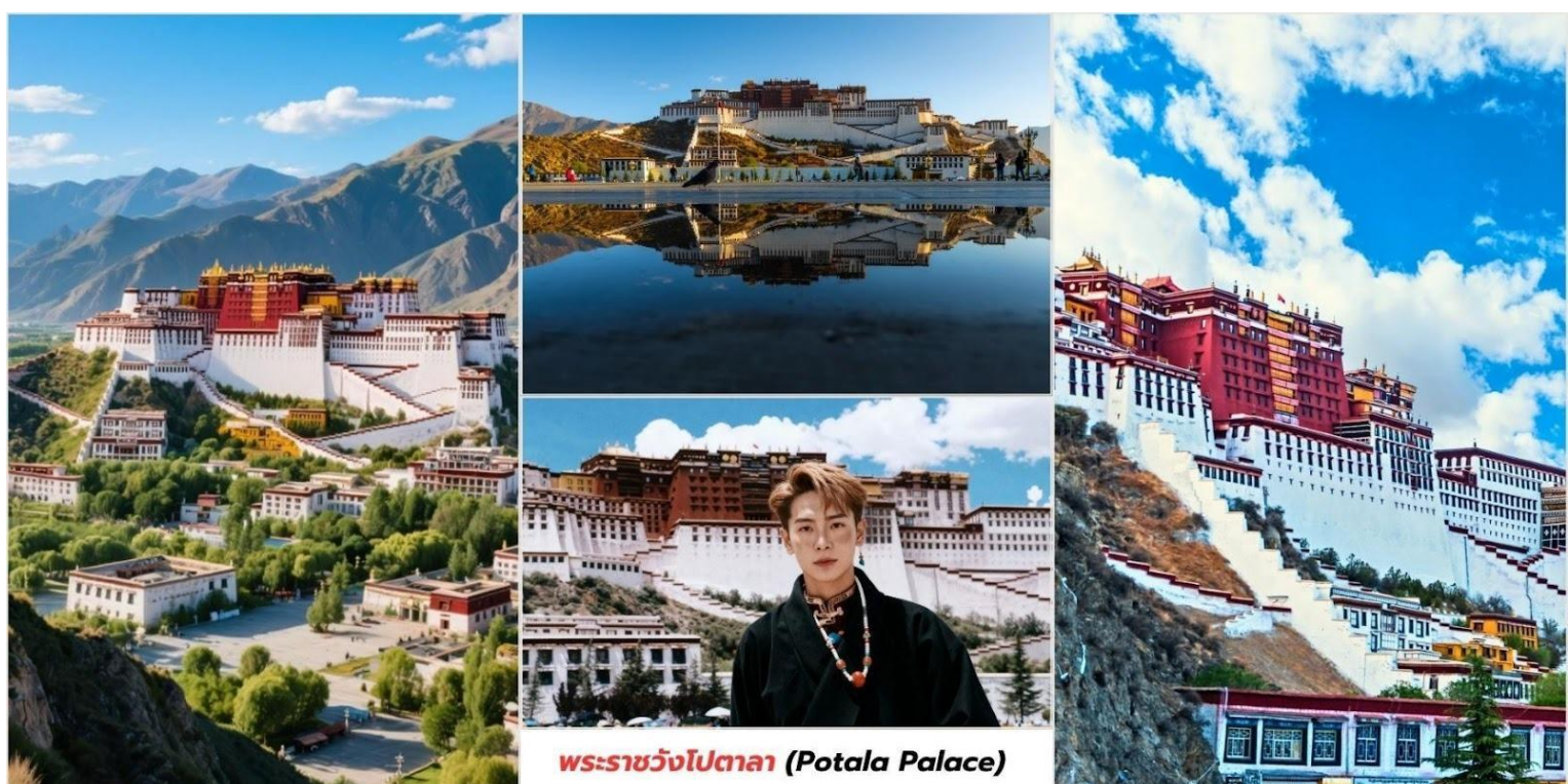
พระราชวังโปตาลา (Potala Palace)

นำท่านชม พระราชวังโปตาลา (Potala Palace, 布达拉宫) ตั้งอยู่กลางเมือง ลาซา (Lhasa) เมืองหลวงของเขตปกครองตนเองทิเบต (西藏自治区) ประเทศจีน เป็นพระราชวังเก่าแก่ที่ตั้งตระหง่านอยู่บนยอดเขา มารโปรี (Marpo Ri, 红山) สูงประมาณ 3,700 เมตรเหนือระดับน้ำทะเลและมีความสูงจากพื้นถึงยอดอาคารกว่า 117 เมตร ทำให้มองเห็นได้จากทุกมุมของเมืองพระราชวังโปตาลาดูยกย่องให้เป็น "หัวใจแห่งลาซา" และ "สัญลักษณ์