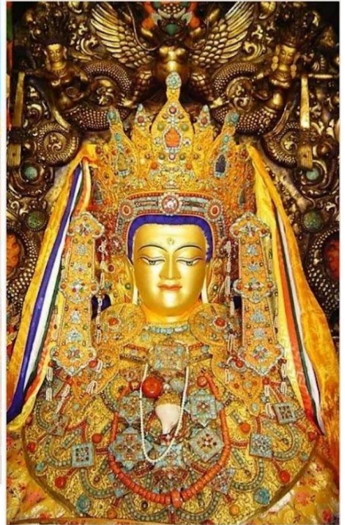
วัดโจคัง (Jokhang Temple, 大昭寺)