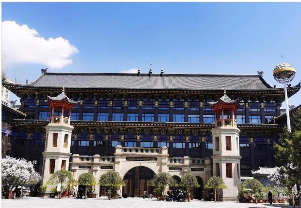
มัสยิดตงกวน (Dongguan Mosque)