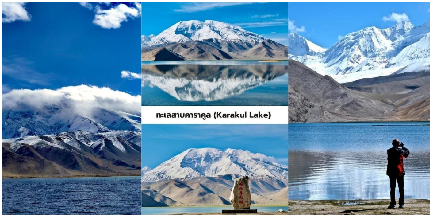
ทะเลสาบคาราคูล (Karakul Lake)

นักท่องเที่ยวสามารถเดินชมทัศนียภาพรอบทะเลสาบและสัมผัสบรรยากาศธรรมชาติของที่ราบสูงปามีร์ที่เจียบสงบ ถือเป็นหนึ่งในจุดชมวิวกูเขาหิมะและทะเลสาบที่สวยงามที่สุดของเส้นทางสายปามีร์