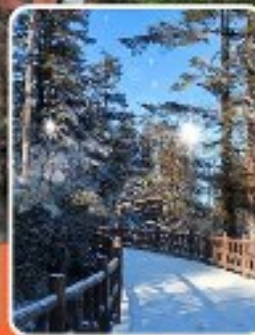
ภูเขาหว่าอูซาน