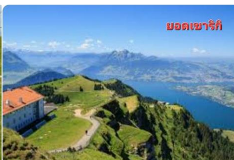
ยอดเขาริกิ

ธรรมชาติ อากาศดี...แล้วนำท่านนั่งรถ ไต่เขา RIGI ถือเป็นรถไฟไต่เขาที่เก่าแก่ ที่สุดในยุโรป จากความสูงจาก