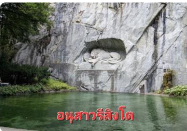
อนุสาวรีย์สิงโต

(LUCERNE) (79 กม.)...นำท่านถ่ายรูปคู่กับ อนุสาวรีย์สิงโต (LION MONUMENT) ซึ่งแกะสลักอยู่บนหน้าผาของ