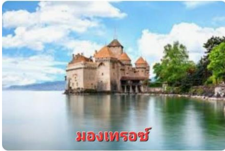
มงเทรอซ์

ออกเดินทางสู่ เมืองมงเทรอ (MONTREUX) (140 กม.) ...ระหว่างทางแวะถ่ายภาพความงดงามของ ปราสาท