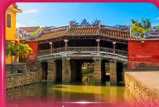
สะพานญี่ปุ่นโบราณ ฮอยอัน