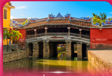
สะพานญี่ปุ่นโบราณ ฮอยอัน