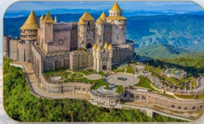
ปราสาทจันทร์

เก้าอี้กระเช้ายาวที่สุดในโลกได้รับการบันทึกสถิติโดย WORLD RECORD ประเภท NON STOP กระเช้านี้มีความยาวถึง 50.42 เมตร