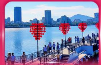
สะพานแห่งความรัก