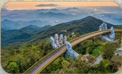
สะพานมือทองคำ