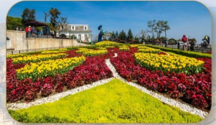
สวนดอกไม้ Le Jardin D'Amour