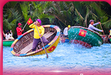
ล่องเรือกระดัง หมู่บ้านกิมทาน