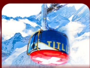
*Optional* นั่งกระเช้าชมวิวกิตติส