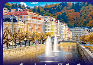
เมืองแห่งสปา คาร์โลว วารี