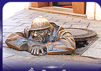
รูปปั้นคูมิล บราติสลาวา