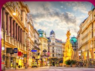
ชมเมืองโรมันติก เวียนนา