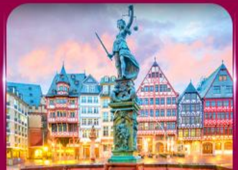
จัตุรัสโรเมอร์ ปรากท์เพิร์ต