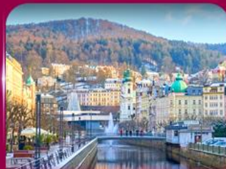
เมืองสปาแสนสวย คาร์โลวี วารี