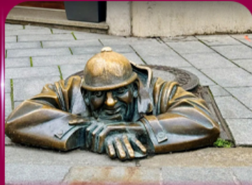
เซลฟี่คู่คูมิล บราติสลาวา