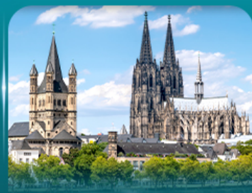
เซ็คอินมหาวิหารโคโลญ