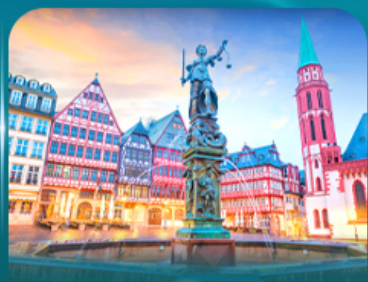
จัตุรัสอิสรเมอร์ แพรงก์เฟิร์ต

เยอรมันเหนือจรดปราสาท เส้นทางคลาสสิก Cologne Berlin Karlovy Vary 8วัน5คืน ธันวาคม 69