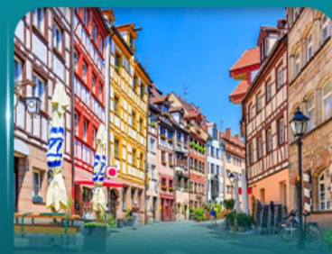
เที่ยวเมืองเก่าบูรมเบิร์ก