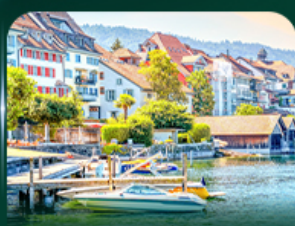
เมืองสวยริมทะเลสาบ ชุก