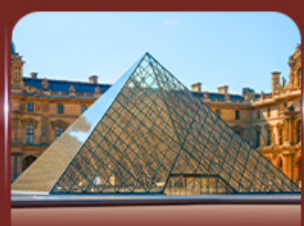
เซ็งอินพีพริกทินท์ลูฟวร์ ปารีส