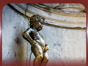
manneken pis บรัสเซลส์