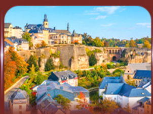
ย่านเมืองเก่า ลักเซมเบิร์ก