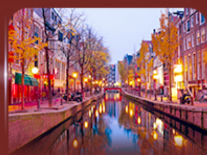
ย่าน Red Light อัมสเตอร์ดัม