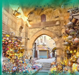
ตลาดผ่านเอลคาลีลี