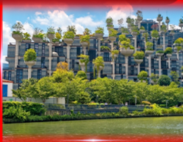
ตึก 1,000 ต้นไม้