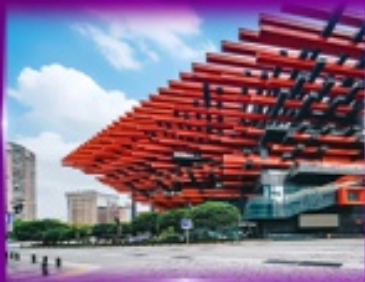
แลนด์มาร์กฉิ่ง ตึกตะเกียบ