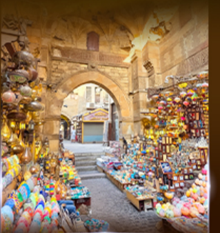
ตลาดห่านเอลคาลี