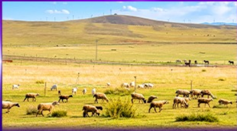
ทุ่งหญ้าซิลามูเฮริน