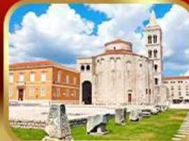
โบสถ์เซนต์โดเมก ชาตาร์