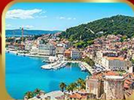
ชมย่านเมืองเก่าสปลิก

14-21 พ.ค. 18 ที่สุดท้าย 73,333.- ปรับลดจาก 75,555