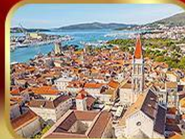
มหาวิหารเซนต์ลอว์เรนซ์