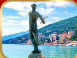
ราชินีแห่งอาเดรียติก โอฟาเทีย