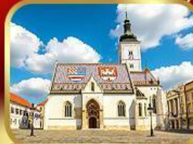
โบสถ์เซนต์มาร์ก ชากรบ