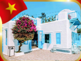
คาเฟ่สุดชิค ซานทรา มารีน่า