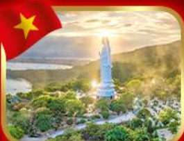
หอพระกวนอิม วัดหลั่นอึ้ง