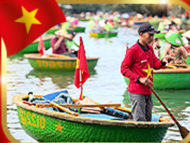
เรือกระด้ง หมู่บ้านกัมทาน