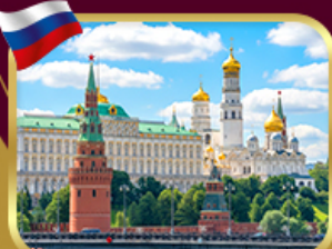
พระราชวังเครมลิน