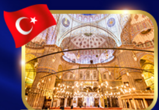
ชมความงามสุหร้าสีน้ำเงิน

OPTION JEEP SAFARI บับร็อยลุกคัปปาโดเก็ย