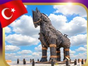
ม้าไม้เมืองกรอย ซานักคาล่า