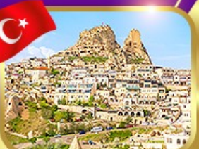
หุบเขาอูซึซาร์ คัปปาโดเกีย