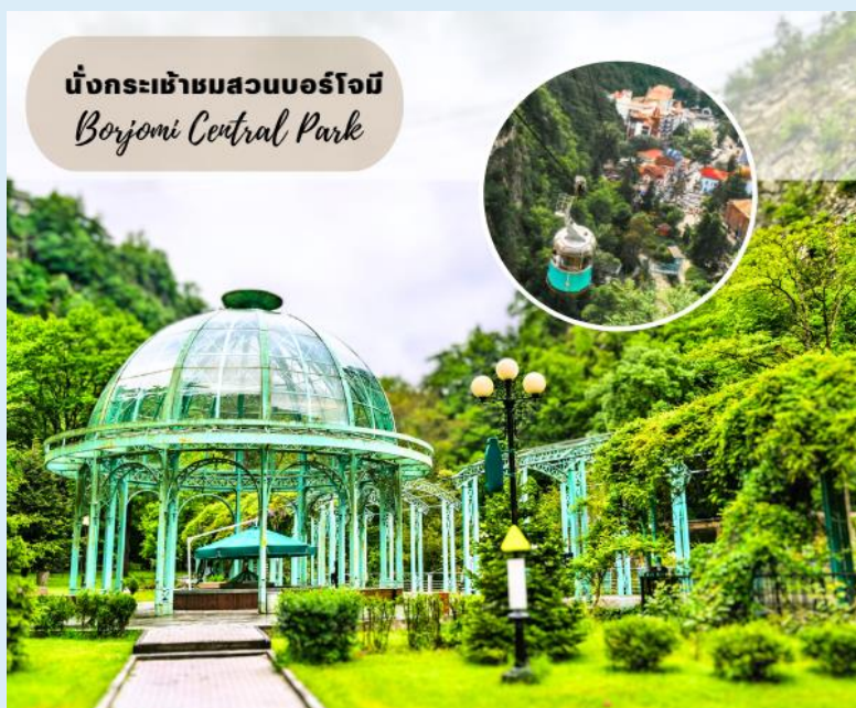
นั่งกระเช้าชมสวนบอร์โจมี Borjomi Central Park

โดยการแช่น้ำแร่ในวันหยุด จากนั้นนำท่านนั่งกระเช้าสู่จุดชมวิวบนหน้าผาเหนือสวนบอร์โจมี