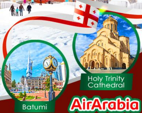
Holy Trinity Cathedral