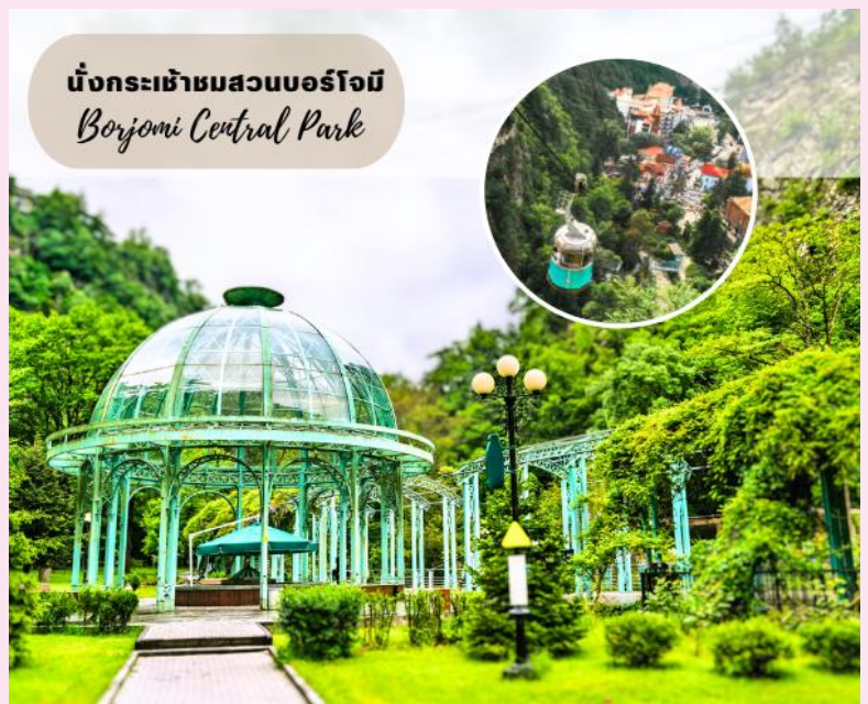
นั่งกระเช้าชมสวนบอร์โจมี Borjomi Central Park

ชม สวนบอร์โจมี (BORJOMI CITY PARK) สถานที่ท่องเที่ยวและพักผ่อนของชาวเมืองบอร์โจมีที่นิยมมาเดินเล่น และผ่อนคลายโดยการแช่น้ำแร่ในวันหยุด จากนั้นนำท่านนั่งกระเช้าสู่จุดชมวิวบนหน้าผาเหนือสวนบอร์โจมี