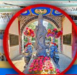
เจ้าแม่กวนอิมต้าลี่