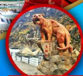
ช่องเขาเสือกระโจน