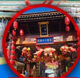
เมืองโบราณต้าหลี่