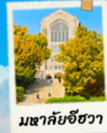
มหาชัยฮิวา