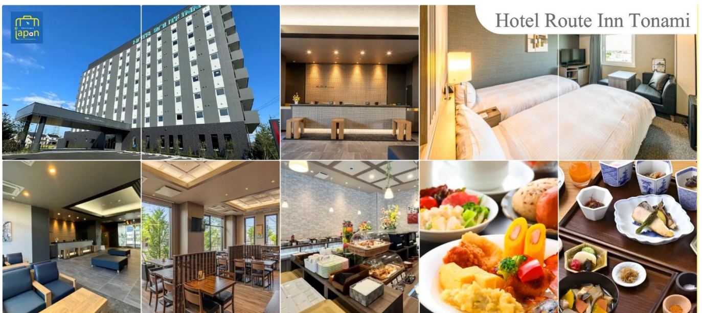
Hotel Route Inn Tonami

ที่พัก HOTEL ROUTE INN TONAMI หรือเทียบเท่าระดับเดียวกัน