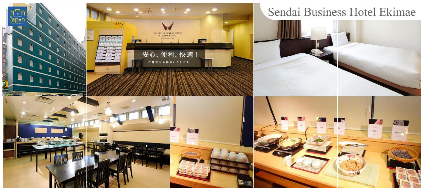
Sendai Business Hotel Ekimae

SENDAI BUSINESS HOTEL EKIMAE หรือเทียบเท่าระดับเดียวกัน