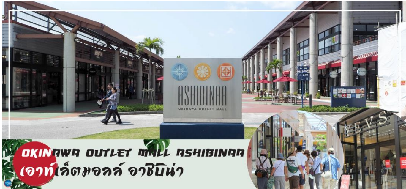
OKINAWA OUTLET MALL ASHIBINAA เอาท์เลตมอลล์ อาชิบิโน่า

จากนั้นนำท่านสู่ เอาท์เลตมอลล์ อาชิบิโน่า (Okinawa Outlet Mall Ashibinaa) (ใช้เวลาเดินทางประมาณ 30 นาที) เอาท์เลตแห่งแรกในโอกินาวะ รวบรวมร้านค้าชั้นนำกว่า 100 ร้าน ทั้งเสื้อผ้าแฟชั่น สินค้าแบรนด์เนม นาฬิกา ข้าวของเครื่องใช้ ของเล่น ทุกร้านจัดเต็มทั้งสินค้านำเข้าและรุ่นใหม่ ลดราคากระหน่ำกว่า 30-80% ให้ได้เดินช้อปปิ้งท้ายทวีปกันอย่างจุใจ ภายใต้บรรยากาศสบายๆ สไตล์รีสอร์ทริมทะเล หากช้อปปิ้งเหนื่อยสามารถขึ้นไปทานอาหารที่ชั้น 2 มีอีกหลายร้านที่คอยให้บริการ