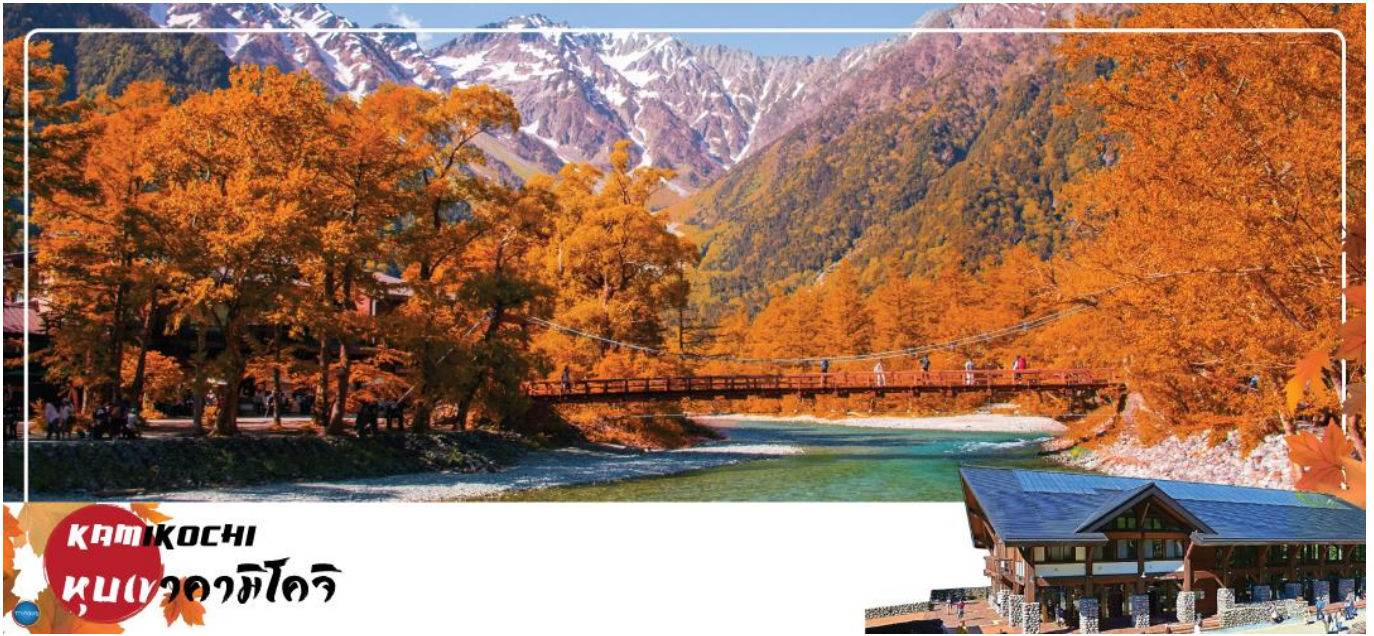
KAMIKOCHI หุบเขาคางาชิโงะ

จากนั้นนำท่านเดินทางสู่ คามิโคจิ (Kamikochi) (ใช้เวลาเดินทางประมาณ 50 นาที) แหล่งท่องเที่ยวทางธรรมชาติที่มีทิวทัศน์ภูเขาที่สวยงามที่สุดแห่งหนึ่งของประเทศญี่ปุ่น ดินแดนแห่งธรรมชาติท่ามกลางหุบเขาแสนสวยของเทือกเขา "เจแปน แอลป์" (Japan Alps) เป็นหุบเขาในพื้นที่อยู่สูงขึ้นไปทางเหนือของเทือกเขาแอลป์ญี่ปุ่น ภาพสายน้ำของแม่น้ำอะซุสะ ที่ใสสะอาดไหลผ่านสะพานคัปปะ ล้อมรอบด้วยต้นป่าเขียวขจี และฉากหลังของยอดเขาสูงตระหง่านระดับ 3,000 เมตรให้ท่านได้เพลิดเพลินกับการเดินเล่นสบายๆ ไปกับธรรมชาติที่สวยงาม อิสระให้ท่านได้เก็บภาพความประทับใจตามอัธยาศัย สะพานคัปปะ-บะชิ เป็นจุดที่มีคนเยอะที่สุดในคามิโคจิ และในบางครั้งก็ให้ความรู้สึกเหมือนทางแยกที่มีชื่อเสียงของชินญะ มีผู้คนมากมายเดินข้ามไปข้ามมาอยู่ไม่หยุดหย่อน มาถ่ายรูปใกล้กับสะพานหรือบนสะพาน นำท่านเดินทางสู่ เมืองมัตสึโมโตะ (Matsumoto) เป็นเมืองที่ใหญ่เป็นอันดับสองของจังหวัดนากาโนะ (ใช้เวลาเดินทางประมาณ 1 ชั่วโมง)