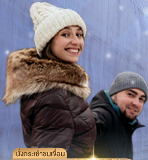
นั่งกระเช้าชมเขื่อน