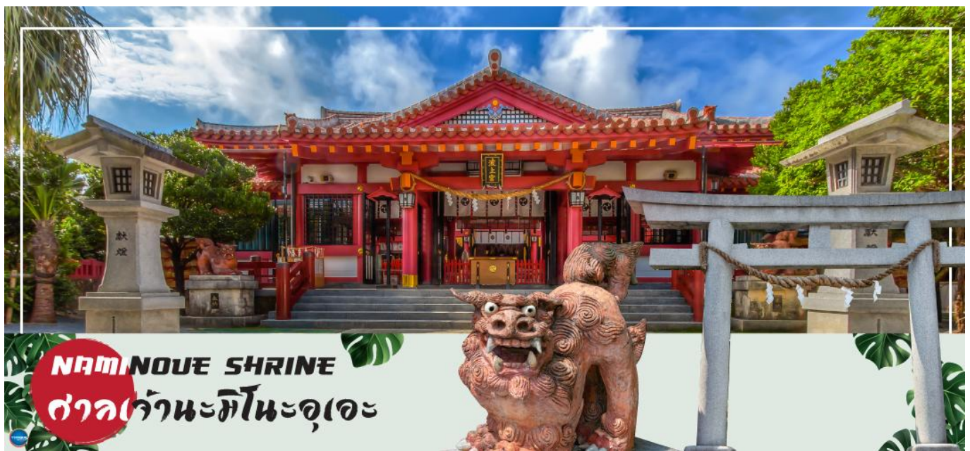
NAMINOUE SHRINE ศาลเจ้านะมิโนะอุเอะ

วันที่สี่ ศาลเจ้านามิโนะอุเอะ – ห้างสรรพสินค้า พาร์ค ซิตี้ – ทำอากาศยานนาสะ โอกินาวา – ทำอากาศยานดอนเมือง กรุงเทพฯ