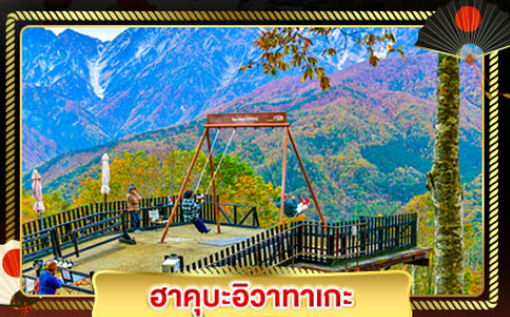
ฮาคุบะอิวากาเกะ