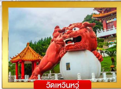
วัดเหวินหลู