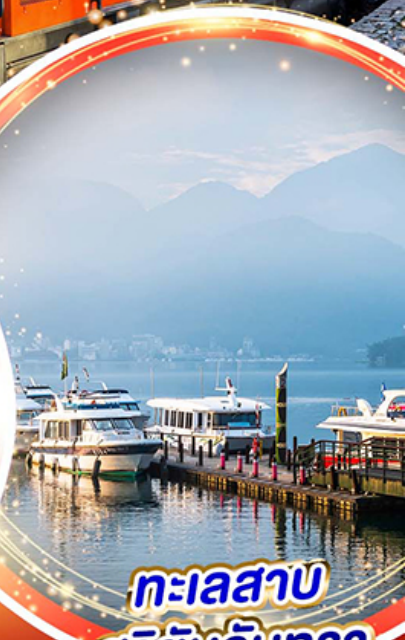
ทะเลสาบ สุริยันจันทรา