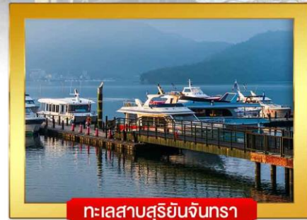
ทะเลสาบสุริยอันจันทร์