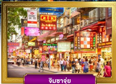
จิมซาจุ่ย