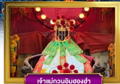
เจ้าแม่กวนอิมสองห้า