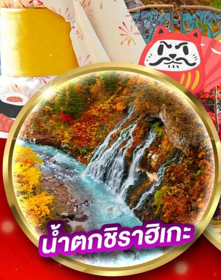
น้ำตกชิราอิเกะ