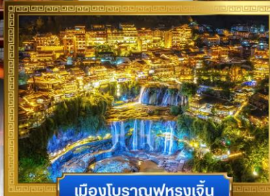
เมืองโบราณฟูหลงเจิ้น