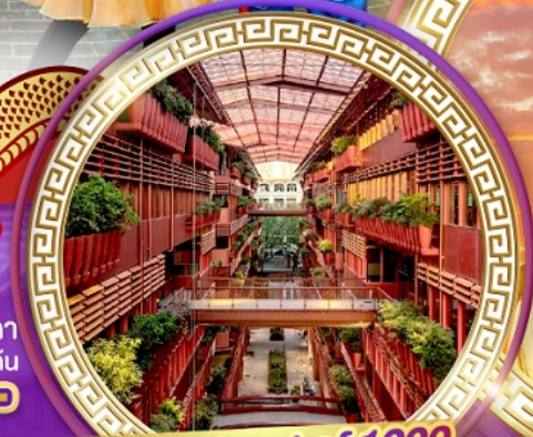
The street of 1000 red jars